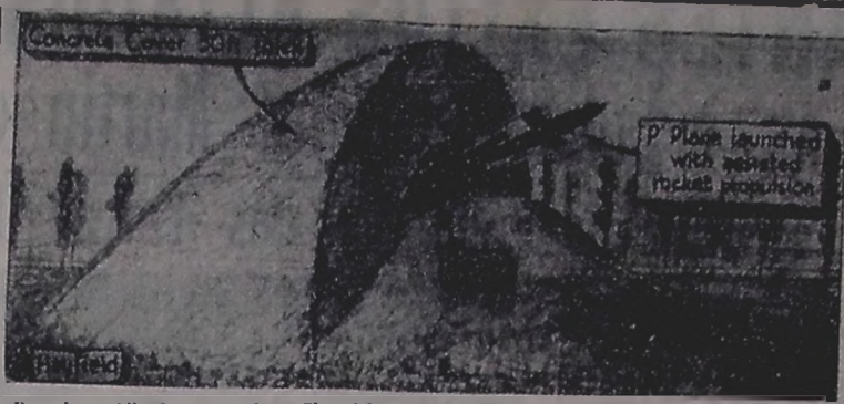
Desenho publicado pelo "News Chronicle", dando idéia de uma base dos aviões sem piloto