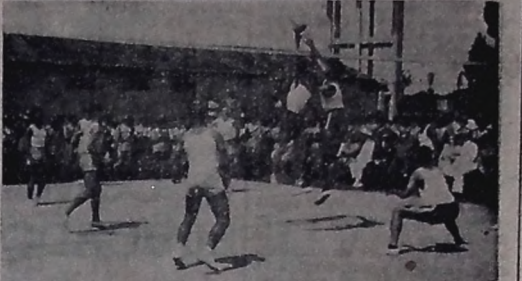
Dois aspectos da disputa de "basket-ball", entre oficiais e aspirantes estagiários