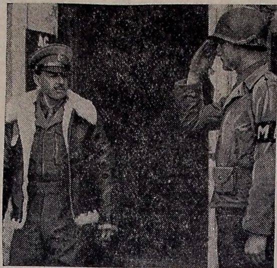
A fotografia mostra-nos o general Alexander, comandante-em-chefe dos Exércitos Aliados na Itália, sendo saudado por um soldado americano.

CHEGARAM A ESTOCOLMO ESTOCOLMO, 3 (U. P.) — Baseando-se em fontes não reveladas, o "Aftonbladet" afirma que os representantes do partido pacifista finlandês já chegaram a esta capital para entrar em entendimento com os representantes russos. Os russos estariam a conceder a paz nas condições anteriores, mas talvez viessem ainda a pedir bases no norte da Finlândia.