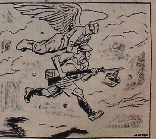
"União Venceremos" (Do EL LOUIS DISPATCH (BNS))

ROMA, 3 (U. P.) — É o seguinte o comunicado das atividades terrestres aliadas na Itália: "Ao sul do monte Lupo, as tropas de uma divisão indú"