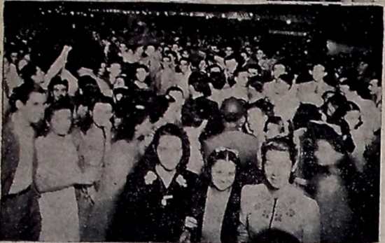
Dois flagrantes do povo na Avenida General Osório

PARA hoje, penúltimo dia da Festa das Neves, prepara-se o nosso povo para maior animação, com o que mostrar-se-á dentro de um positivo zelo pela sua tradição.