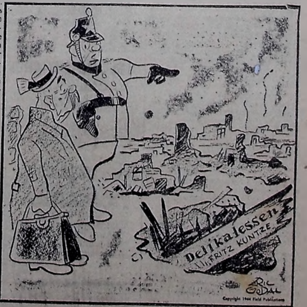
P — O acougueiro? R — Dois quarteirões depois do Ministério da Aviação