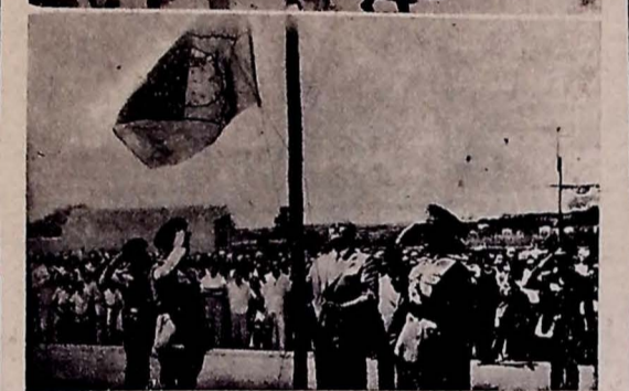
Dois flagrantes das solenidades ocorridas em Campina Grande, vendo-se ao alto, o interventor Ruy Carneiro, coronel Edgard de Oliveira, comandante da 2.ª Brigada de Infantaria, autoridades e o povo quando seguiam para o novo Quartel do 2.º Batalhão da Força Policial do Estado. Em segundo plano, o interventor Ruy Carneiro, no momento em que hasteava a Bandeira Nacional.