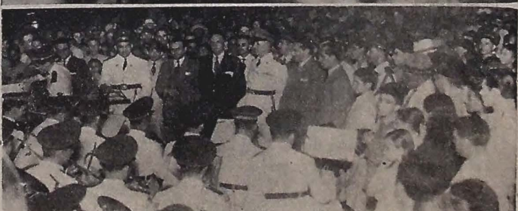
Flagrantes das festas ocorridas no Parque "Solon de Lucéna", vendo-se em terceiro plano as danças populares e, por último, o interventor Ruy Carneiro quando, em companhia do comandante da 2.ª Brigada de Infantaria, secretários de Estado e autoridades, ouvia um concerto da Banda da Força Policial.