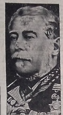
Duque de Caxias

ASBINALANDO a passagem do Dia do Soldado, realizamos hoje em todo o país, grandes manifestações públicas em homenagem ao Duque de Caxias. Irmãos de todos os sentimentos de cívico e entusiasmo patriótico, o brasileiro rememora a figura simbólica