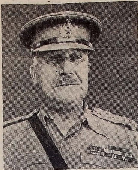
General "Sir" H. Maitland Wilson, comandante supremo aliado, na zona do Mediterrâneo.

WASHINGTON, 18 — (U. P.) — O secretário de Estado, sr. Cordell Hull, declarou, ontem, que provavelmente em agosto próximo se realizaria aqui uma série de conversações entre os representantes dos Estados Unidos, Russia, China e Inglaterra. Essas conversações versarão sobre a organização da segurança internacional no pós guerra. Em seguida serão realizadas identicas conversações com todos os representantes das Nações Unidas.