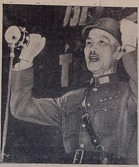
GENERALÍSSIMO CHIANG-KAI-SHEK — A China, a velha e heróica China que há tanto tempo vem lutando contra os nipônicos, está, ao lado das Nações Unidas, empenhada na tarefa de assegurar definitivamente a sua independência e a sua soberania. Os seus soldados tem recebido treinamento do exército norte-americano e inglês. Em Assam e na Índia os nossos aliados do Oriente estão sob o comando de "Lord" Mountbatten, Comandante Supremo dos Aliados no Sudoeste da Ásia. No clichê, o generalíssimo Chiang-Kai-Shek fala aos seus soldados, durante a sua visita de inspeção ao centro de treinamento chinês na Índia.

NOVA YORK, 5 (U. P.) — Uma transmissão da NBC (Conclue na 2.ª pag.)