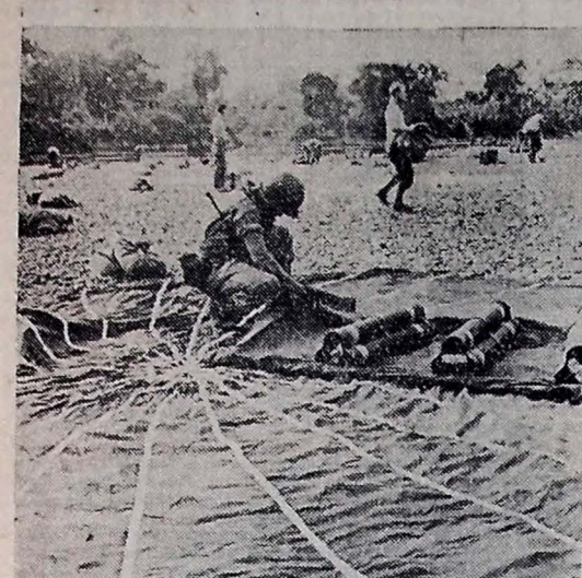
AVANÇO NA BIRMANIA — Soldados norte-americanos que avançam na Birmania desembarcam petrechos lançados em paraquedas. O emprego de aviões de transporte e planadores permitiu às forças atacantes estabelecerem poderosas bases de operação na retaguarda das linhas japonesas neste setor de guerra.

SUPREMO Q. G. ALIADO, 19 (U. P.) — Informa-se que as forças britânicas, enfrentando do grande oposição por parte do inimigo e tendo que travar, por vezes, luta corpo a corpo, se apoderaram de parte da cidade de Tilly-sur-Seuilles, enquanto os alemães mantêm em seu poder a parte sul. (Conclue na 2.ª pag.)