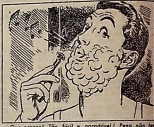
— Que prazer! Tão fácil e agradável! Pena não ter começado há mais tempo a barbear-me com Gillette!