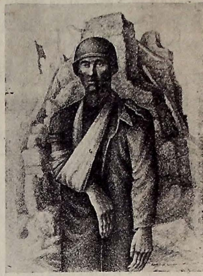
Junho (S. I. H.) — Expedicionário brasileiro ferido visto através de artístico desenho de autoria de Mitchell Siporin. Da coleção do Departamento da Guerra dos Estados Unidos. (Foto do Serviço de Informações do Hemisfério).

PARIS, 30 (U. P.) — O Supremo Comando Aliado e os russos aceleraram o repartimento quanto à distribuição de tropas soviéticas e aliadas dentro das respectivas zonas de ocupação. Acrescentou o Supremo Comando Britânico que norte-americanos e franceses irão para Berlim, deixando outras zonas de ocupação para as tropas soviéticas. Espera-se que a transferência dessas tropas estará terminada dentro de 3 dias.