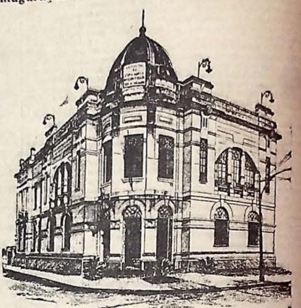
Fachada principal da Escola Técnica de Comercio "Epitácio Pessoa", nesta Capital.

Inauguração amanhã das suas novas instalações