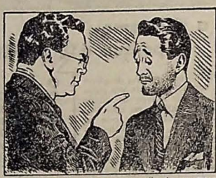
— A culpa é sua! Com um aparelho de segurança Gillette, não há perigo do contágio de infecção!

POR que expor-se ao perigo, sem nenhum proveito? Se está nas suas mãos evitar um malefício, por que correr o risco, temerariamente? Lembre-se de que as infecções da pele, muitas vezes, são transmitidas por navalhas que serviram a outras pessoas. Não deixe que isso lhe aconteça! Defenda seu rosto de contágios, barbeando-se sempre em casa, com um moderno aparelho Gillette e as legítimas lâminas Gillette Azul.