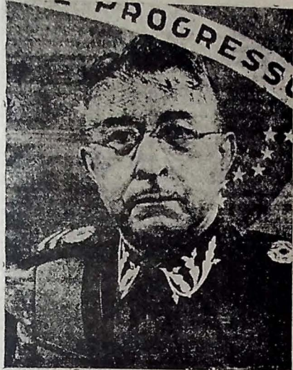
GENERAL MASCARENHAS DE MORAES

SOB O COMANDO DO GENERAL ZENOBIO DA COSTA, 5.360 SOLDADOS DEIXARAM, ONTEM, NAPOLES, A BORDO DO TRANSPORTE NORTE-AMERICANO "GENERAL MEIGS"