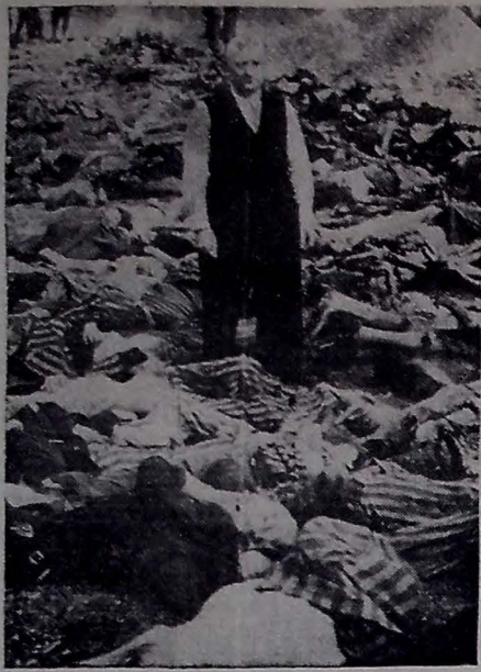
EM LANDSBERG — O comandante do campo de concentração nazista de Landsberg, perto de Munich, é visto no meio de suas vítimas que foram queimadas vivas ou fuziladas antes da chegada das forças norte-americanas.

O sr. Avila Camacho aceitou a renúncia endereçando ao sr. Padilla uma carta ontem, cujos (Conclui na 6.ª pag.)