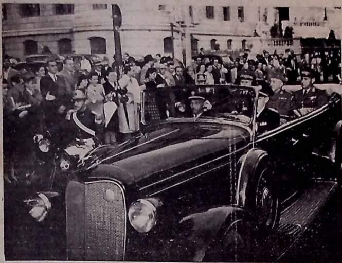
A CHEGADA AO RIO DO COMANDANTE DA F.E.B. — Sob vibrantes aclamações da população carioca, desfila pela avenida Rio Branco o general Mascarenhas de Moraes, que tem à direita, o general Eurico Gaspar Dutra, Ministro da Guerra.

Tem-se como provável a participação do general De Gaulle no desenvolvimento da conferência Churchill-Truman-Stalin — Esclarecimento da política que os exércitos de ocupação desenvolverão na Alemanha