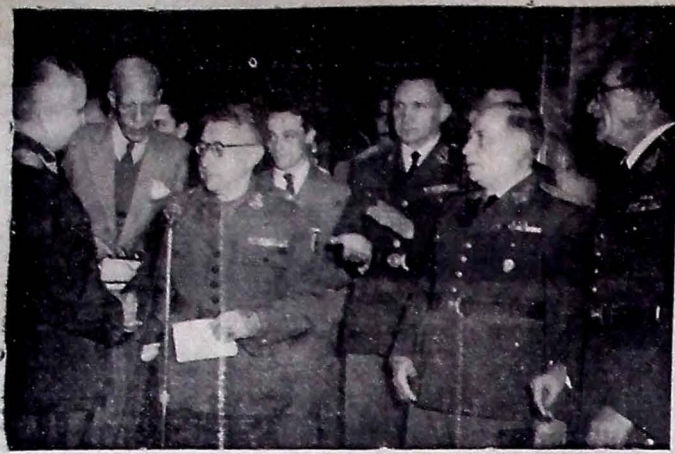
O general Mascarenhas de Moraes quando pronunciava sua oração de agradecimento, durante a solenidade com que o hor enageou o Exército, no Palácio da Guerra.