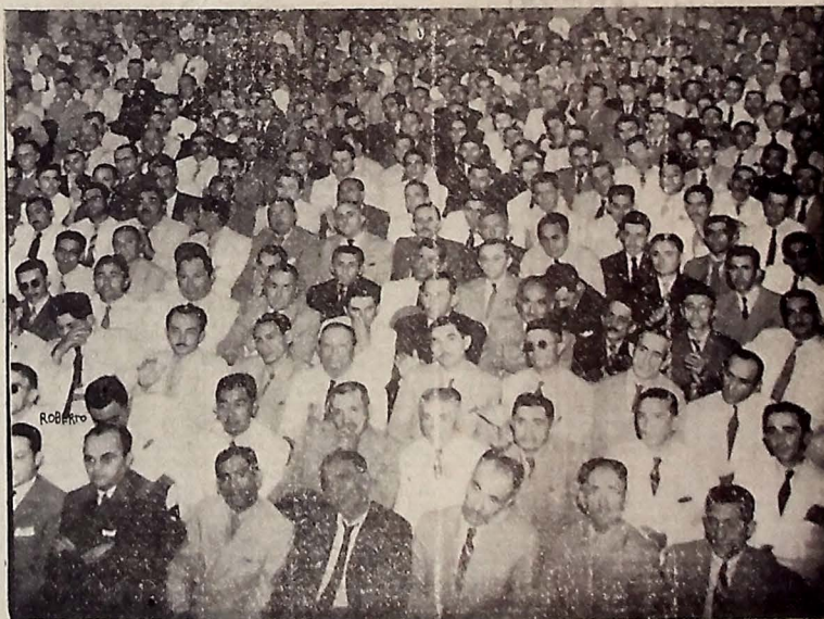
Com sua lotação excedida, o "Cine-Teatro REX" apresentou, em 7m, belo espetáculo cívico-político, com a Convenção do Partido Social Democrático, secção da Paraíba, que homologou a candidatura do general Eurico Gaspar Dutra à presidência da República.