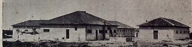
Colônia Penal de Mangabeira — Aspecto parcial das edificações já concluídas. Uma das grandes realizações do governo Ruy Carneiro.

O ultimo desses conflitos teve, porém, merito de desmoralizar, para sempre, o velho conceito egoistico; já agora, em todos os países civilizados, renouam-se concepções de liberdade economica e financeira, adaptando-se aos criterios do homem e ás reais necessidades da communhão universal. Justamente, nesse sentido, e que se orienta o decreto, agora promulgado pelo governo brasileiro, dispondo sobre certos contrários á ordem moral e economica. Tambem, fruto de uma época — época de reconhecimento de valores, de preparação de paz perpetua. (Conclue na 5.ª pag.)