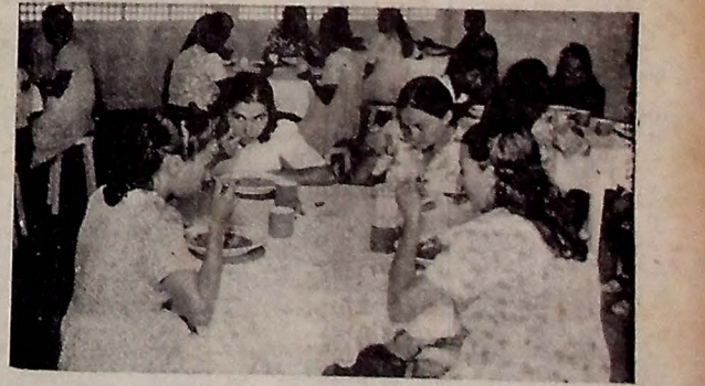
Flagrante da cantina maternal do Centro de Puericultura de Cruz das Armas

carta. Tendes sobejas razões de estar orgulhoso do vosso papel, nessa Conferência, desde o seu inicio. Por solicitação do sr. Cordell Hull, depois da Conferência de Moscou em 1943, vos, sub-secretário de Estado organizastes e dirigistes os preparativos para a Conferência dos Estados Unidos á Conferência de Dumbarton Oaks. Postes a mão direita de Roosevelt em Yalta, onde se tomou nova decisão para a organização mundial, em que se concordou efetuar a Conferência das Nações Unidas. Todos os preparativos para a Conferência de S. Francisco foram feitos sob vossa organização". (Conclue na 6.ª pag.)