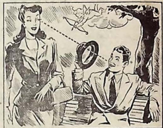
— Agora eu sou o "tal"! É só olhar e zózi! Por que? Uso o Gillette e deixo correr suavemente o morfim...