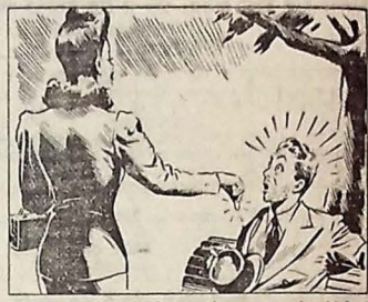
— Que vexame, meu Deus! Alisar-me um níquel! Será que me confundiu com um pedinte? É de amargar!...