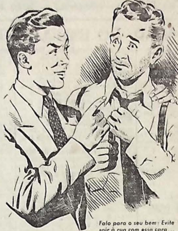
Fala para o seu bar: Evite sair de rua com essa cara...