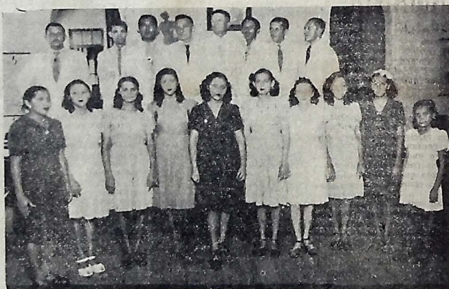
Flagrante da visita dos Diretórios masculino e feminino do Centro Político "Martim Leitão", do Passeio Geral, à redação da A UNIAO.

Manifestação em palácio ao interventor Ruy Carneiro — Visitas dos diretórios masculino e feminino ao Chefe de Polícia, Prefeito da Capital e diretor do D. S. P. — Na A UNIAO