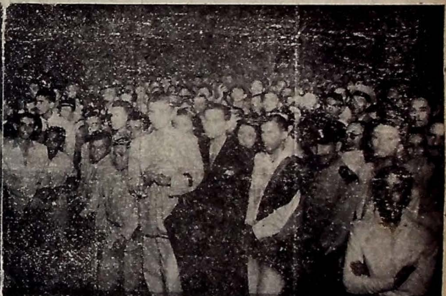
Dois flagrantes do comício monstro realizado, ante-ontem á noite, no Parque Solon de Lucena, em regojo pela vitória das forças aliadas contra o nazi-fascismo, e no qual discursaram vários oradores, entre os quais o dr. Samuel Duarte, Secretário do Interior, que se vê na gravura á esquerda, quando falava á grande multidão.