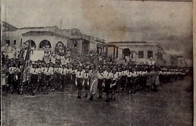
Flagrante das grandes manifestações de regosijo realizadas em Campina Grande, no "Dia da Vitória". A mocidade das escolas e grande massa popular desfilaram pelas principais ruas da cidade. — (Noticiário na 6.ª página).