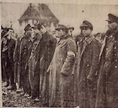
CAPTURADOS — Deprimido e mal vestidos esses soldados nazistas, aprisionados pelo Exército norte-americano, são representantes de contingentes que foram capturados durante a invasão do território alemão.

Um porta voz britânico declarou que esses submarinos possivelmente se dirigiram ao território de algum porto ou ponto de refugio provavelmente do sul do território sul-americano, africano ou mesmo norte americano onde desembarcaram as suas tripulações e passageiros. Ao mesmo tempo exprime-se uma declaração conjunta de Londres e Washington proclamando o Atlântico livre completamente da ameaça submarina pela primeira vez desde 1939. A declaração esperada para dentro de poucos dias indicará que as vias marítimas para passageiros estarão limitadas unicamente em consequência da pouca disponibilidade de embarcações. Um porta voz dos altos círculos navais disse que é impossível a existência de submarinos não