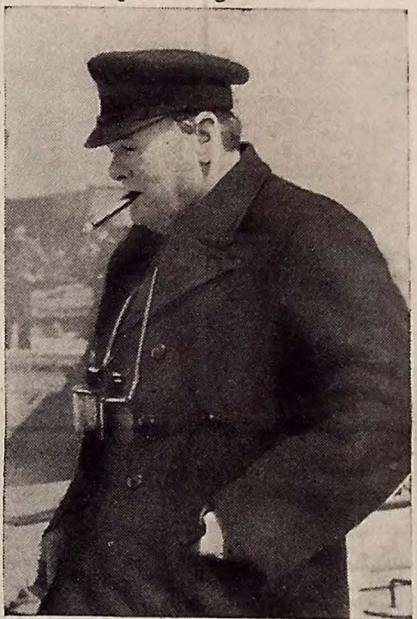
diol inglês está centralizada em mãos do governo, esse é sempre um dos assuntos mais controvertidos. Espera-se que a comissão atribuirá um total de 20 discursos a cada chefe de Partido. (Conclue na 6.ª pag.)

AS AGITAÇÕES DO LEVANTE Delegados sírios e libaneses lançam um protesto na Conf. das Nações Unidas — Advertência da Grã-Bretanha à França