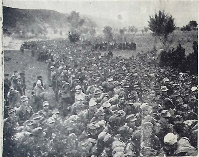
APRISIONADOS PELA F. E. B. — O flagrante acima mostra antenas de prisioneiros capturados pela Força Expedicionária Brasileira nos últimos dias da ofensiva sincronizada dos exércitos aliados na Itália.

Os norte-americanos anteriormente haviam estendido 4 porções de terra para os cercados pelas águas do Salto, que subiram muito nos últimos dias.