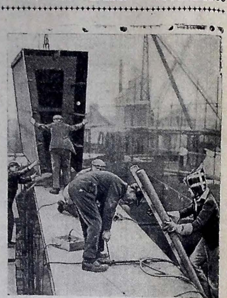
NAVIOS PREFABRICADOS BRITANICOS — Operários do Estaleiro "Henry Scarr Ltd., Hull", armam um navio de bolso, prefabricado.

RIO, 28 — O Tribunal Superior Eleitoral apreciando uma consulta do Presidente do Tribunal do Estado de Mato Grosso sobre a composição desse órgão em face dos impedimentos dos juizes, declarou que os membros impedidos só não funcionarão nos processos em que tenham parentes interessados, sendo este afastamento momentâneo.