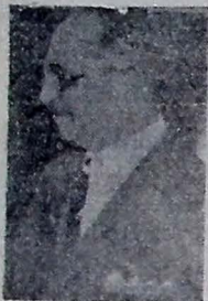
O sr. Nereu Ramos, vice-presidente da República e presidente do P. S. D.

Os meios políticos estão voltados para a eleição da