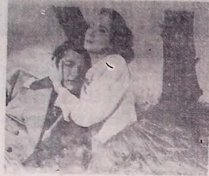
Umá cena de "A Noite Sonhamos" que está em exhibição desde ontem no REX.

A vida e os amores de Chopin, e o seu romance com George Sand servem de tema e esse bellissimo film em que vemos nos principais Paul Muni, Cornel Wilde, como Fre-