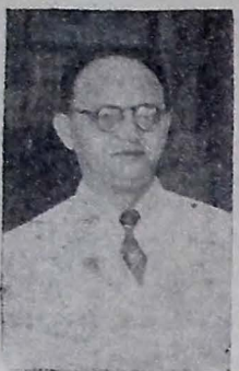
O deputado Agamenon Magalhães, chegado ontem ao Rio, onde fez importantes declarações sobre a política pernambucana.

sessão de hoje o mandato de segurança, requerido pelo PSD gaúcho contra a proclamação de seus deputados petebistas estaduais naquele Estado pelas sobras eleitorais. O PTB foi majoritário, ob-