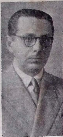
O ilustre desembargador Agrippino Barros, presidente do Tribunal Regional Eleitoral e que presidirá os trabalhos da instalação da Assembléia Legislativa do Estado.

O Governo do Estado, por intermédio da Secretaria do Interior, não mediu esforços no sentido de dotar a Câmara Estadual das instalações indispensáveis, inclusive mobiliário moderno e confortável, tendo sido, assim convenientemente adaptada a sede do Legislativo Paraibano.