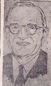
O presidente Truman, que ora realiza uma visita oficial ao Mexico

cracia nos assuntos internacionais". Essa politica guiará as nações para a meta da paz e segurança internacional".