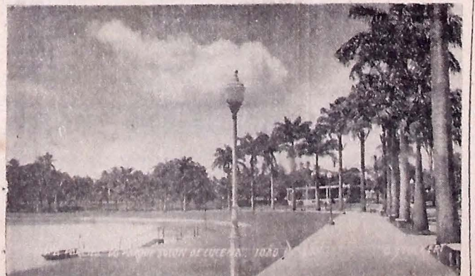
A NOSSA CIDADE — O clichê mostra uma visão do Parque Salom de Lucena, moderno e central logradouro publico de João Pessoa.