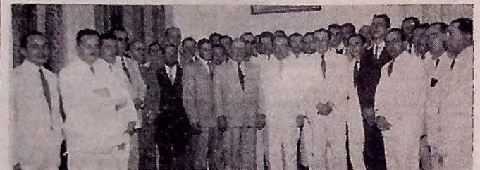
Aspecto da manifestação dos advogados paraibanos ao governador Oswaldo Trigueiro

Os advogados militantes em nosso foro prestaram, ontem, pelas 17 horas, significativa manifestação de apreço ao governador Oswaldo Trigueiro