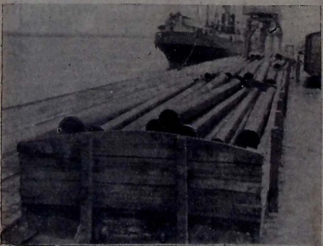
Ganhos da linha adutora do abastecimento de água de Alagôa Grande, desembarcados no dia 14, do navio "Hembuy" no porto de Cabedelo, quando eram conduzidos para aquela cidade em carros da Great Western

VARSOVIA — (BIP) — O famoso arquiteto francês Le Corbusier assim se expressou sobre o Congresso Mundial de Intelectuais que atualmente está deliberando em Wrocław na Polónia. "Sempre tenho sido inimigo de