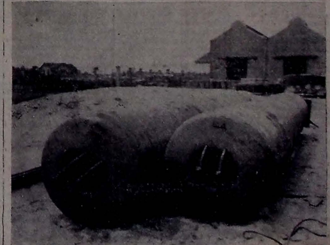
Tubos condensadores, adquiridos pelo Governo do Estado, para renovação do material dos Serviços Elétricos, desembarcados em Cabedelo, do navio "Rio Paraíba", no dia 12 do corrente