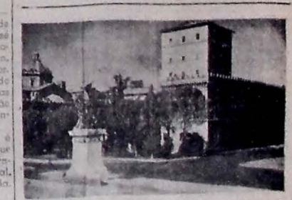
O ANTIGO PALACIO VENEZA em Roma, utilizado por Mussolini (o famoso balcão está sobre a porta á direita) é a sede da Segunda Assembleia Mundial de Saúde. O sr. Assunção se reúne com o fim de planejar a campanha das Nações Unidas contra as enfermidades, através da Organização Mundial de Saúde.

RIO, 2 — (Asopress) — Fônes chegadas dos Campos Eliseus informam que