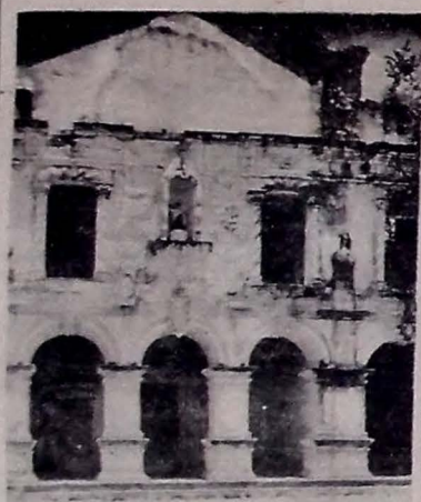
A monumental fachada, em que o artista deu largas à sua fantasia inspirada em motivos regionais.

ROMA, 2 — Segundo a agência Aisa, numa notícia procedente de Trieste, a negociação com segurança de que o marechal Tito está pedindo um empréstimo de 800 milhões de dólares aos Estados Unidos para comprar armamentos. A agência Aisa indica que o marechal Tito pensa reformar o seu Governo para torná-lo mais estável. (Conclua no 4.º pag.)