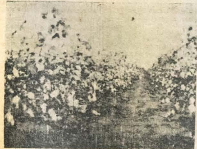
Produzem magnífico algodão.

crise a ser humano é mais culta e mais avançada na civilização.