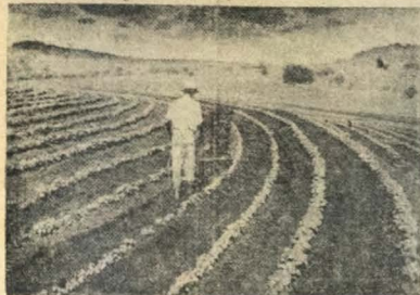
COM orientação racional e a ajuda do Poder Central, milhares de hectares de terra brasileira poderiam ser cultivados e

De certo que é uma missão importante pela sua finalidade patriótica, só merecendo aplausos e elogios, se não fora o destino que os Congressos tem tido, logo após suas realizações a