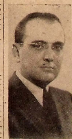
Pela manhã de ontem, o Governador Oswaldo Trigueiro esteve em Campina Grande.

quatro esteve em Esperança, visitando em companhia do prefeito Julio Ribas, o Posto de Higiene do Estado e o local onde se verificou a explosão ocorrida na semana passada.