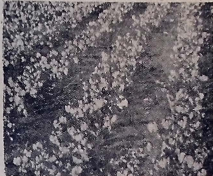
Esplendorio campo de cooperação de 1948 no município de Taboão, da variedade Campina 817