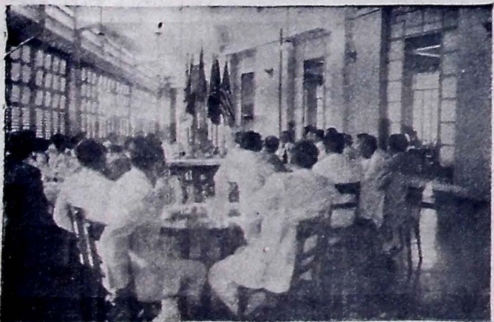
Flagrante colhido durante a recepção ao governador Oswaldo Trigueiro, promovida pelo Rotary Club de Campina Grande, quinta-feira última.

CAMPINA GRANDE (De correspondente) — Entre as homenagens que foram prestadas ao governador Oswaldo Trigueiro, por ocasião de sua recente visita à esta cidade, destacou-se a recepção feita a sua excelência, pelo Rotary Club local, quinta-feira última. Durante essa recepção