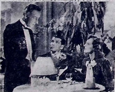
Quinta-feira no PLAZA Complemento com a reportagem do jogo BRASIL x BOLÍVIA

por preço convulativo, a tratar à Rua 5 de Novembro (Caruaru).