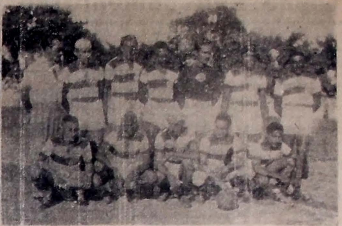
1.º — A equipe do OLARIA que derrotou o AUTO ESPORTE por 4 x 2. 2.º — O "onze" do AUTO, que apesar da derrota foi um adversário de valor das cariocas