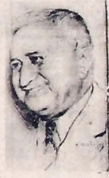
Presidente Eurico Dutra que o saudaram, pronunciou o presidente Eurico Dutra, pelo microfone da Agência Nacional, ali instalada, a seguinte oração de todo o país: "Meus amigos! A passeigem, durante o meu governo, de mais um 1.º de maio, proporcionar-me o êxito para me dirigir a todos (Conclui na 4.ª pág.)

RIO, 2 — Os deputados federais por São Paulo, na unanimidade de suas bancadas e Assembleia Legislativa do Estado, por todos os partidos políticos, são representados a Sociedade Rural Brasileira, pelo Instituto de Economia Rural e Departamento das Associações Rurais do Estado de São Paulo, a Associação dos Lavradores de Café, a Sociedade Rural de Caramuru (Café), a Associação Comercial de São Paulo e a de Santos — fizeram entrega ao presidente da República de um memorial "representando o seu pensamento e suas profundas preocupações em face do problema que no momento ameaça as próprias fôrças da economia cafeeira". A representação que é longa declara em seu início que o Decreto-lei n.º 9418 de 28.4.49 "sobre o plano de licitação de lavagem e comércio de café de São Paulo, atribuiu a Junta Consultiva integrada por representantes estatutários dessas classes a faculdade de se pronunciarem sobre o plano de licitação de refinação do café". "Desse modo, o estatuto, essa obrigatoriedade legal a D.N.C. iniciou em meados de 1948 várias atividades de café que repercutiram desfavoravelmente nos mercados". Refere-se depois o memorial ao clamor desperdiçado nas classes interessadas e que motivou o (Conclui na 4.ª pág.)