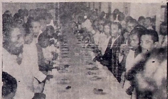
Aspecto do "lunch" oferecido aos operários no Mosteiro de São Bento, como parte das comemorações do DIA DO TRABALHO.

Tiveram início, sabido as comemorações de 1.º de Maio, na Paraíba, com a realização de várias agremiações, inclusive uma partida de futebol entre o 13.º de Campina Grande e a AFA desta cidade em disputa da jaca "Pereira Lima". Valeu-se os jogadores por 2x1 a assistência calculada em 18.000 pessoas, teve entrada gratuita no Campo C. Branco. Ante-ontem, continuaram os festejos e o programa elaborado em o seguinte: No domingo às 6 horas houve Alvoada com uma salva de 21 tiros, e as 7 horas — Missa celebrada pelo arcebispo Metropolitano, com a participação dos operários católicos. Às 8 horas realizou-se um Lunch oferecido aos que fizeram a pássoa no pássoa do Mosteiro de S. Bento. Às 10 horas na sede da Delegacia Regional do Trabalho realizou-se a exposição das fotografias do Presidente Eurico Gaspar Dutra e Ministro José Pereira Lima, chefe do Gabinete Civil da Presidência da República, patrocinado respectivamente pelo Governador Oswaldo Trigueiro e Arcebispo Metropolitano D. Moisés Coelho. Enrolou-se ainda no salão sobre da D. R. um cruel fixo.