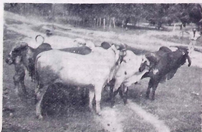
LOPE de esplêndidos garrotes, todos filhos de MAMORE e de reprodutoras selecionadas, também a disposição dos criadores do Estado.

Sem vacinar não vale a pena criar. O Departamento da Produção tem sempre em estoque vacinas de qualidade