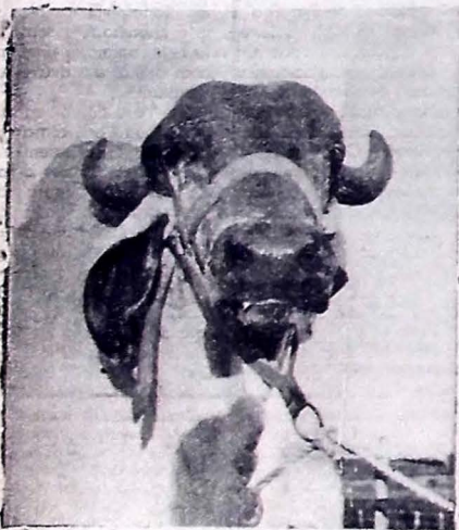
MAMORE magnífico raçador da Fazenda Mumbaba, vindo de Curvelo no Estado de Minas.

A escola, em prédio adequado e com uma frequência de cerca de sessenta alunos, tem duas professoras. Uma paga pelo município e outra pelo Estado, em uma cooperação feliz.