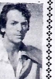
DOUGLAS FAIRBANKS JR.

Douglas Fairbanks, Jr. vive o papel d Rei Carlos II da Inglaterra, o qual no ano de 1660 se refugiou na Holanda e conforme conta a história se apaixonou por uma linda holandêsa que lhe deu abrigo quando estava sendo perseguido pelos asseclas de Cromwell