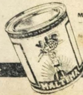
VIC MALTEMA — o alimento ideal para todos os horos.

DE MANHÃ — o estomago está vazio, o apetite é grande. Tome, pois, com leite frio, gelado ou quente, um grande alimento: VIC MALTEMA. Vic Maltema é riquissimo em propriedades nutritivas, gostoso e de facil digestão. Vic Maltema não "enche" o estomago, alimenta de verdade.