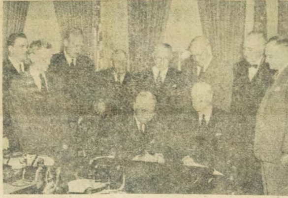
Esta foto registra, tirada em 26 de setembro, na Casa Branca, Москва o Presidente Truman quando assinava a Lei de Acórdia, Constitucional Restricções de 1945, assinada em 1951 e programa de acordos comerciais com EE. UU. Vê-se ainda o sr. Cordell Hull, à esquerda do presidente a outros representantes do governo norte-americano.

RIO, 21 — (M.) — O vice-presidente Nerere Ramos, depois da reunião do PSD, declarou: "O Conselho Nacional do PSD transferiu para 30 de janeiro próximo, às 10 horas da manhã, sua convenção nacional que terá marca da para 3 de dezembro do corrente ano. Deliberação ainda convocar o Conselho Nacional do PSD para uma reunião sábado, às 21 horas, convidando os governadores do PSD, a fim de deliberar sobre a proposta do deputado Benedito Valadares, no sentido de serem levadas à UDN nacional, por intermédio da seção mineira do partido, nomes que foram aprovados no Conselho Nacional do PSD para candidaturas de conciliação ou interpartidárias, tirados da seção mineira do PSD."