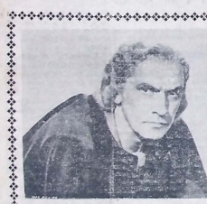
(Fredric March — Cristovão Colombo)

BRASIL — Hoje matineas das Moças às 16 horas — AMOR CIGANO