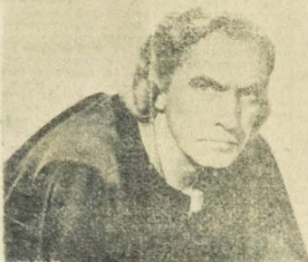
(Fredric March — Cristovão Colombo)

AVISO! — Para as exhibições do film CRISTOVÃO COLOMBO ficam sem efeito os permanentes da empresa e entradas de favor, com excepção das autoridades e imprensa.