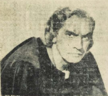
(Fredric March — Cristovão Colombo)

ASTORIA — Hoje — Soirée às 19½ hs. RUA SEM NOME