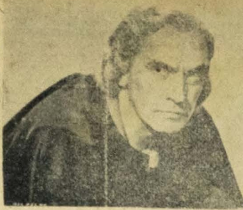
(Fredric March — Cristovão Colombo)

AVISO! — Para as exhibições do film CRISTOVÃO COLOMBO ficam setu efeito os permanentes da empresa e entradas de favor, com exceção das autoidades e imprensa.