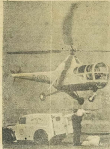
HELICOPTERO CORREIO — Os técnicos britânicos estão realizando experiências com helicópteros para o transporte de cargas do curso na Grã-Bretanha. Serviços semelhantes, com o lançamento de pacotes de cartas, foram realizados a fim de demonstrar a eficiência da serviço. Veja na fotografia um momento em que o helicóptero descarrega e toma malas postais.

Declarações do sr. Arnolfo Arias a respeito dos despachos de Washington de que os EE. UU. não reconhecerão o novo governo do Panamá