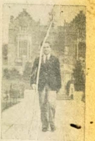
O REI DO IRAQUE NO COLÉGIO DE HARROW — Vemos aqui o jovem rei do Iraque, de 14 anos de idade, passando pelos jardins do antigo colégio de Harrow, onde está completando sua educação. É conhecido pelos seus colegas como Feisal Hussein. O sr. Feisal é filho do rei Ghazi, segundo o Emir Abdul Ilah, foi feito regente durante a menoridade do rei atual.

Se tais esperanças se confirmarem, ter-se-á efetuado a maior descoberta científica até agora conseguida neste terreno.