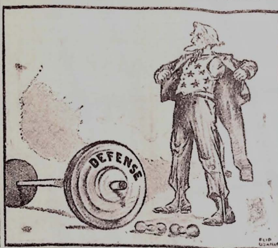
"Para Fortificar seus músculos": Uma caricatura que apareceu recentemente no "Hartford Courant", um jornal americano publicado em Hartford, Connecticut.

"O estabelecimento desse crédito é um marco no desenvolvimento econômico do Brasil. Segundo os termos em que foi concedido, o Brasil terá a garantia de um fluxo constante de produtos siderurgicos nacionais. (Conclui na 4ª pág.)"