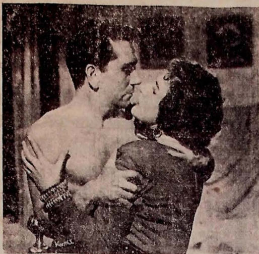
Uma cena do filme: "Mercado de Ladrões"

Valentina Cortesa, a grande estrela italiana, estreia em Hollywood, em "Mercado de Ladrões", um drama vigoroso e empolgante da 20 Th Century Fox, onde a esplendida atriz encontrou oportunidade para uma magnífica performance. — Richard Conte ator também de alta classe, aparece com Valentina Cortesa nessa película extraordinária, que foi dirigida por Jules Dassin e que marca um dos mais brilhantes sucessos de temporada