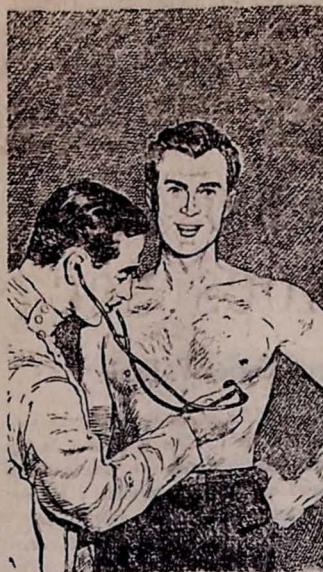
Um exame médico periódico pode ajudá-lo a conservar o coração sempre EM FORMA.