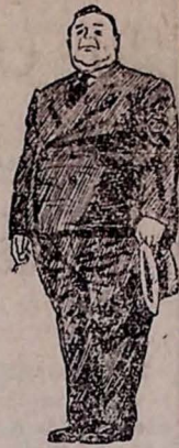
EXCESSOS PERIGOSOS: Pêso demasiado — Muita atividade Especialmente depois dos 40 anos!