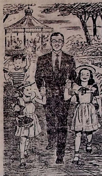
As doenças do coração, tratadas como devem, podem ajudá-lo a viver uma vida longa e ativa.

As doenças do coração estão entre as que causam maior número de mortes! E não precisaria ser assim. Os modernos instrumentos médicos como o raio-X, a radioscopia e o eletrocardiógrafo permitem diagnósticos mais rápidos, mais exatos. As novas drogas que hoje existem abreviam infecções e a consequente sobrecarga que estas representam para o coração. E novas conquistas, no terreno da cirurgia do coração, podem corrigir defeitos antes irremediáveis. Quem sofre do coração tem hoje perspectivas mais encorajadoras do que nunca.