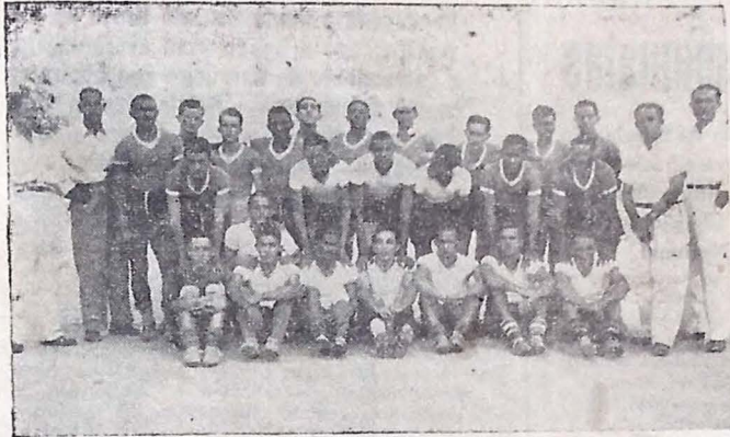
Aqui estão os valerosos integrantes do Selecionado da Paraíba. Dentre eles sairá o poderoso conjunto que irá medir forças, hoje, com o Rio Grande do Norte, no estádio do Cabo Branco.

Empolgará os meios esportivos tabajarinos a disputa desta tarde no Cabo Branco, entre paraibanos e potiguares — Em disputa do Campeonato Brasileiro de Futebol — Os locais são favoritos na disputa de hoje — Estima-se em 20 mil o numero de pessoas que afluirá ao Estádio de Juagaribe — Os quadros — O árbitro