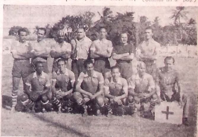
A seleção de Pernambuco, que depois de muito custo, abateu o "scratch" paraibano, domingo ultimo, no Recife.