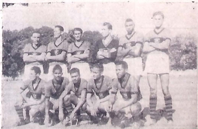
Aqui estão os valorosos defensores da Paraíba. Lutaram com energia e vontade de vencer, mas o juiz não deixou... Esses rapazes foram os verdadeiros heróis da batalha travada domingo ultimo nos Agitados, na capital pernambucana.

area, afim de inutilizar a ação do insider paraibano, mas tratou Barbosa adotou a inversão da diagonal e dentro de pouco tempo o SCRATCH de Pernambuco estava svelido e sua defesa em panico. Guaberiños, não fora os dois tentos que marcou, nada se (Conclusão na 6.ª pag.)