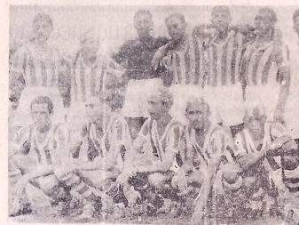
O team do AUTO, que depois de brilhante performance venceu o BOTAFOGO, levantando o torneio início.

Alcançou um êxito inusitado nos desportos pessoais a realização da festa de abertura da temporada polibolística deste ano domingo último, no estádio do Esporte Clube Cabo Branco, no bairro de Jaguaribe. Um grande público compareceu ao local da competição, aplaudindo com entusiasmo todos os lances que se passaram na cancha da av. 1.º de Maio, uma vez que a sequência de jogos apresentada satisfaz plenamente o espectador geral.