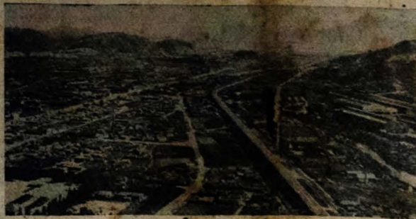
A cidade de Pusan, principal porto de suprimento das Forças das Nações Unidas, no combate à agressão à República da Coreia. Pusan era o objetivo final da escala dos comunistas para a completa derrota das Nações Unidas, cujos esforços, contudo, fizeram cessar as pretensões comunistas.

Faltado sobre esse movimento, o sr. Neves da Fontoura declarou que a eleição de Getúlio Vargas era um caso liquidado. Não falou sobre a matéria nem com Cristiano Machado nem com o brigadeiro Eduardo Gomes. Acentuando que o brigadeiro visitou quando antes das eleições, quando se encontrava hospitalizado. Quando pretendia pagar-lhe a visita, Eduardo Gomes se ausentara.