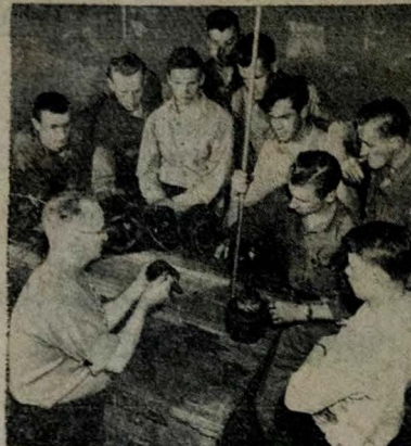
Jovens rapazes e moças nas Estados Unidos aprendem em cursos especializados, segundo suas vocações, para garantir-lhes um futuro imediato, assim que terminem seus cursos. Os sistemas de escolas públicas fornecem aulas práticas, as quais se executam em todas as escolas dos 48 estados, com um número de matriculados superior a 3.500.000 alunos. O programa é auxiliado pela Lei de Educação Vocacional, aprovado pelo Congresso em 1917.

A solução, que tende a ligar a noção de hierarquia ao salário de base, parte de uma concepção absolutamente diferente. Não fixa "a priori" posições relativas para as diferentes categorias profissionais; seus dois elementos determinantes são, de uma parte, a obtenção de uma remuneração global correspondente uma justificação (Conclusão na 3ª pág.)