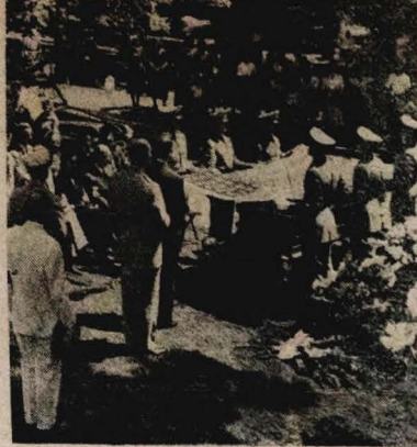
O Tenente Howell G. Thomas, Jr., do Exército dos Estados Unidos, morto em serviço, por ocasião de combate levado a efeito pelas tropas das Nações Unidas na República da Coreia. Foi a primeira perda norte-americana no conflito coreano. A foto apresenta seu enterroamento no Cemitério Nacional de Arlington. Os funerais contaram com a presença de Chefes do Exército, altas patentes militares das demais armas e Representantes da Embaixada da Coreia em Washington.

Após, houve várias projeções cinematográficas de filmes educativos e científicos.