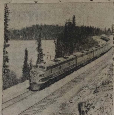
A foto mostra a locomotiva Diesel e o carro de passageiros da 285ª Divisão, em trem de passageiros que opera entre estações que são São Francisco, na Califórnia, e Los Angeles, em Oregon, na costa do Pacífico, numa extensão de 718 milhas. O trem passa ao margem do largo Ogdell no sul do estado de Oregon. Durante o ano de 1949 as estradas de ferro dos Estados Unidos transportaram 526 bilhões de toneladas-milhas de frete, em todo o país. (USIS)

RIO, 11 — (M) — Inicialmente A MANHÃ, matutino político, que no momento do presidente Dutra (com o sr. Danton Coelho, este escolhido ao chefe da Nação) a propósito de seu partido promover a constituição de um governo de coalisão, revelando o desejo que o PSD colaboraria para esse desiderato. Terminou falando do presidente Dutra para que interrompa sua autoridade no sentido de que seja obtida essa cooperação da parte do PSD. Acrescenta o referido matutino que o presidente Dutra agradeceu a comunicação, acentuando, porém, (Conclui na 2.ª pag.)