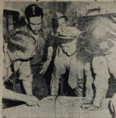
O General Walton L. Walker (segundo, à direita para a esquerda), General Comandante do Oitavo Exército dos Estados Unidos, mostra, em seu quartel general na República da Coreia parte das operações, a seus comandados, chefe de operação.

Espera-se que os resultados da conferência do presidente Truman com o general Mac Arthur, no Pacífico, sejam revelados no discurso que o chefe da governação norte-americana pronunciará em São Francisco, a 17 do corrente mês. Acreditase que o presidente Truman pedirá a Mac Arthur a rápida liquidação da campanha da Coreia, afirmando que as tropas norte-americanas naquele país possam ser enviadas para a Alemanha Ocidental.