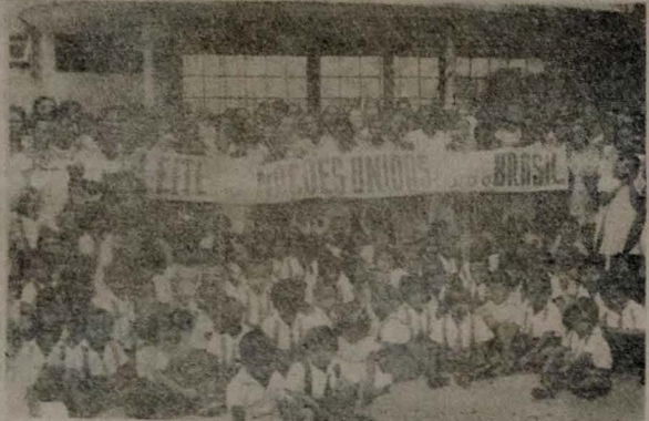
Foto colhida ontem no Centro de Puericultura de Cruz das Armas, vendendo-se a multidão de crianças ladoando o Chefe da Agência da ONU e as autoridades sanitárias.