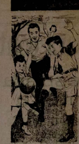
At. fracco, exercicio, boa alimentacao e vida moderada contribuem para evitar a Tuberculose.