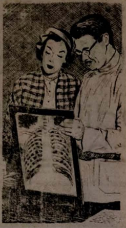
O Raio-X revela a Tuberculose no seu começo — quando a cura e mais facil.

Não permita a propagação da Tuberculose! A Tuberculose e mais frequente entre os 15 aos 45 anos. Não e hereditaria, mais e muito contagiosa! E se propaga com muita facilidade entre pessoas de saude afadada. Mantennam-se fortes e sadios — voce e sua familia — com uma dieta sa e nutritiva, exercicios ao ar livre e bastante horas de sono. Não deixe de procurar seu medico, o anualmente, para um exame fisico completo. Esta e a sua melhor protecao para vencer a Tuberculose.