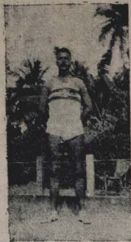
RUBEM valoroso defensor do CABO BRANCO