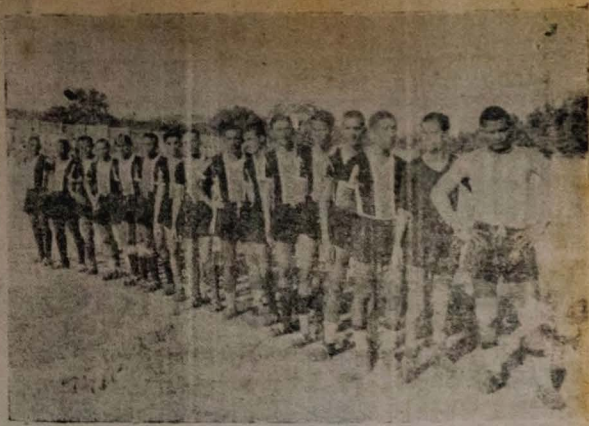
OS DOIS RIVALS DA NOITE DE HOJE: — Aqui estão os quadros do Botafogo, tri-campeão da cidade e do SANTA CRUZ do Recife, que estarão em luta, hoje à noite, no Cabo Branco.