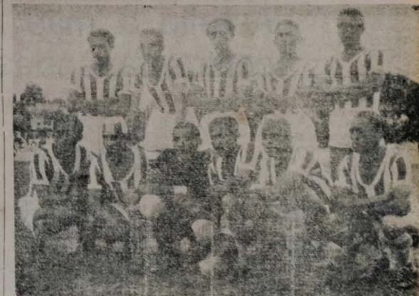
A equipe do AUTO ESPORTE, vice-campeão de 1949, que será o segundo adversário do SANTA CRUZ, amanhã à tarde.

das todas as situações da noite ao público esportivo e técnico será assistido por um numerosíssimo público. O quadro do AUTO ESPORTE, vice-campeão paraba-