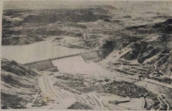
A fotografia mostra a represa do Grand Coulee, no Rio Columbia, no estado de Washington. Esta represa é a principal de um projeto de construções de reservatórios e fontes de irrigação, que o governo dos Estados Unidos realizou na bacia do Rio Columbia. É a maior fonte de energia elétrica nos Estados Unidos. O 13º gerador elétrico foi inaugurado pelo Presidente Truman, em cerimônia oficial realizada a 11 de Maio de 1950. A represa do Grand Coulee produz 1.404.000 Kw, energia suficiente para servir uma cidade industrial com uma população superior a 1.250.000 habitantes.