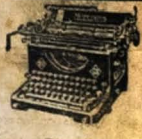
Consorcia S. S. FERREIRA Máquinas de Escrever. Numerar. Calcular. Mimeografar, etc.