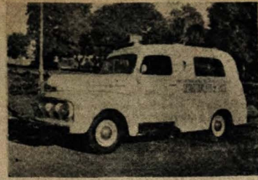
Ambulância adquirida pelo Governo, do Estado para o Departamento de Saúde. Trata-se de uma iniciativa da SECRETARIA DE EDUCACAO E SAUDE dotando o Centro de Saúde da Capital de um permanente meio de transporte para portadores de doenças contagiosas agudas. Fica, desta forma, o Serviço de Epidemiologia daquele Centro capacitado a atender com eficiência e rapidez as suas finalidades.