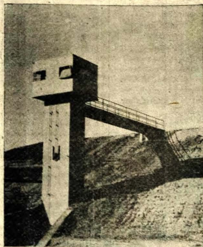
(Foto Referência n. 2) — Bomba centrífuga de 8 polegadas, adquirida e instalada pelo Governador José Américo para o abastecimento de emergência — Situa-se esse equipamento está a 6' de altura recebendo mais 3 milhões de litros d'água

nesta oportunidade de mostrar o que se vem fazendo, existem compensações morais incensáveis e consoladoras, que animam os atuais Governantes, certos do critério apurado do povo.