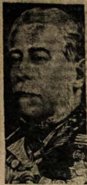
Duque de CAXIAS

A data que hoje transcorre significa o nascimento de Luiz Alves de Lima e Silva Duque de Caxias, o Patrono do Exército Brasileiro. Sobre a personalidade imortal desse militar e estadista, que soube honrar a sua pátria, firmou a história um julgamento tão significativo que vale como a recompensa das glórias de casaca e honoras nos Brasil confuso ao seu insigne filho.