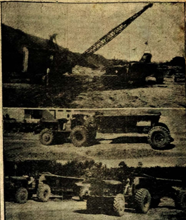
Possantes máquinas adquiridas pelo Governador José Américo a título de empréstimo da Inspeção Federal de Obras Contra as Secas, para dar novo e vigoroso impulso às obras de Marés.

Diante da situação de abandono em que foi encontrada a obra, ressalvada, é claro, a capacidade técnica insuperável dos critérios Saturnino de Brito e dado também destaque ao que o notável empreendimento representa como plano de engenharia sanitária, diante da situação aterrorizante em que fora encontrada a obra, só mesmo uma visão experimentada e arguta como a do primeiro magistrado do Estado lograria o quasi — milagre conseguido: o da vinda da água do rio Marés, por antecipação do emendamento da barragem, até as torneiras das residências urbanas. O fenômeno foi, todavia, simples: ideou S. Excia. e fez executar a montagem de uma bomba centrífuga de 8 polegadas